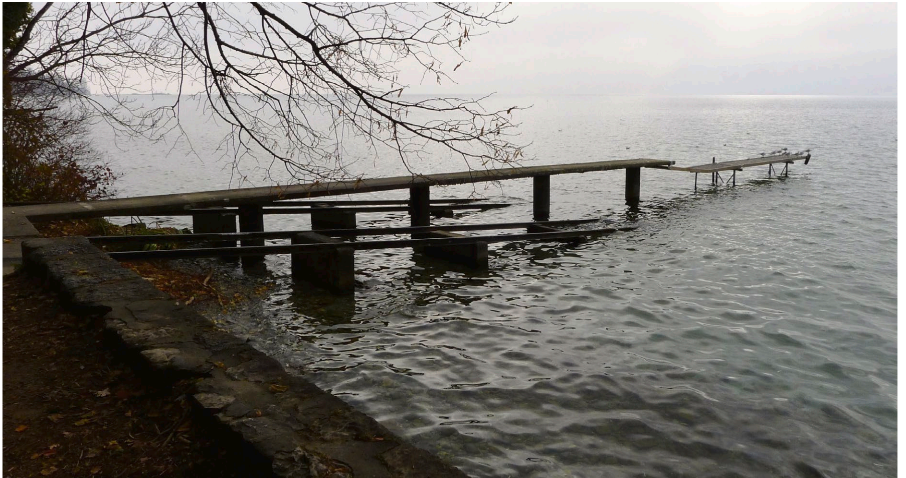
Weite prägt die Wanderung: Am Schluss kam ein durchwegs natürlicher Abschnitt: Mit Kies, Sand und Parkwiesen.

Achim Parterre: «Im Säli». Heimatgeschichten. Cosmos-Verlag, Muri b. Bern, 2014, 125 Seiten, 30.90 Fr.