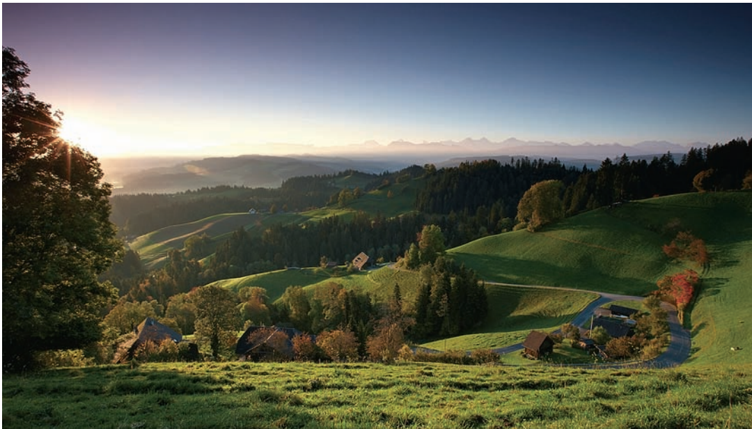
Lauschige Landschaft: Krimischauplatz Emmental bei Achim Parterre

Zahlreiche Autoren haben das Krimi-Genre entdeckt: Die literarische Beschäftigung mit dem gewaltsamen Tod lebt mehr denn je. Die kulturtipp -Redaktion hat eine Auswahl der jüngsten Schweizer Erscheinungen aus den Regionen zusammengestellt.