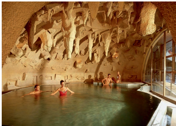
Leukerbad: Ein Mord und viele unheimliche Begegnungen